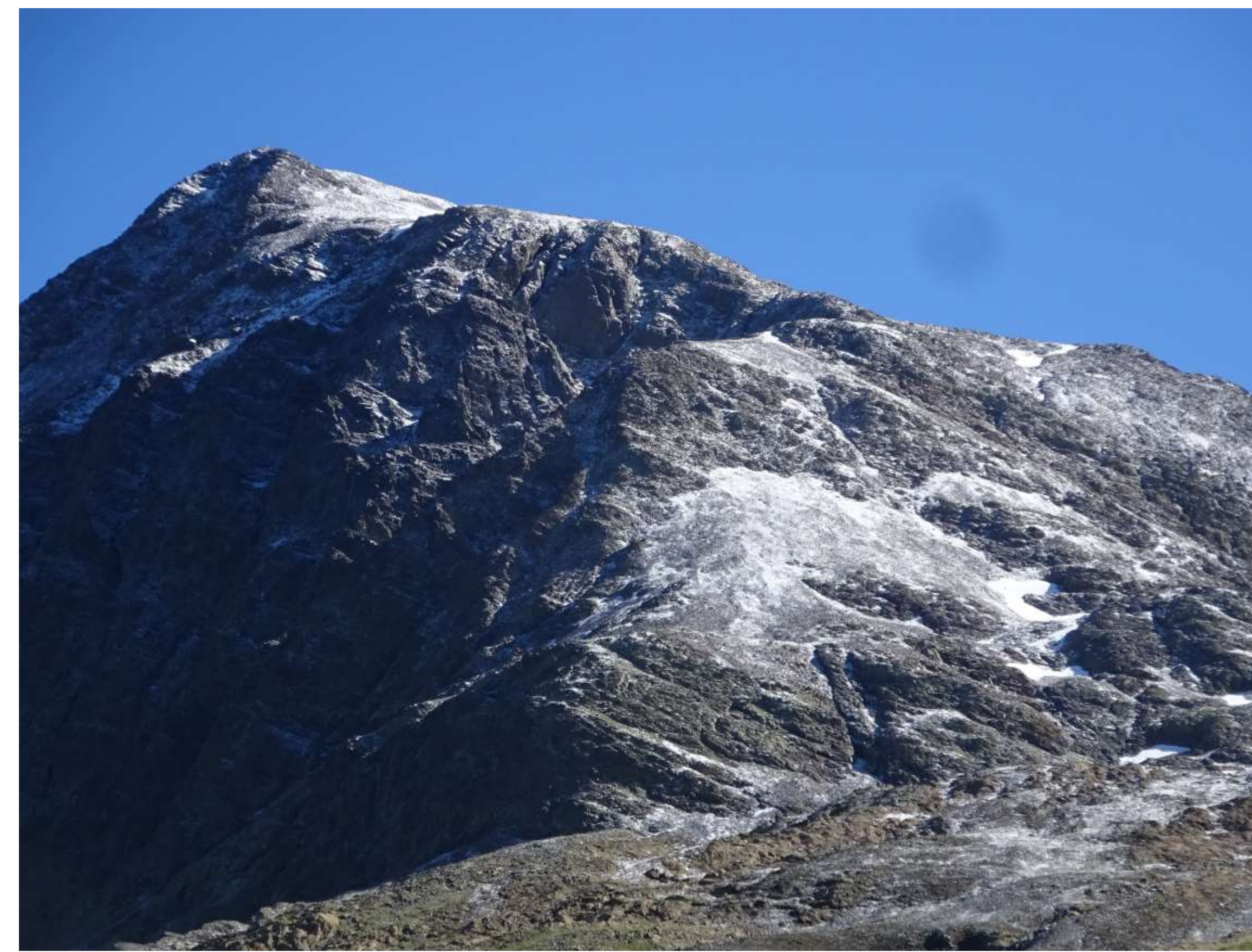
30 juin, ouverture du chantier, le Vieux Chaillol est plâtré de la neige tombée dans la nuit.