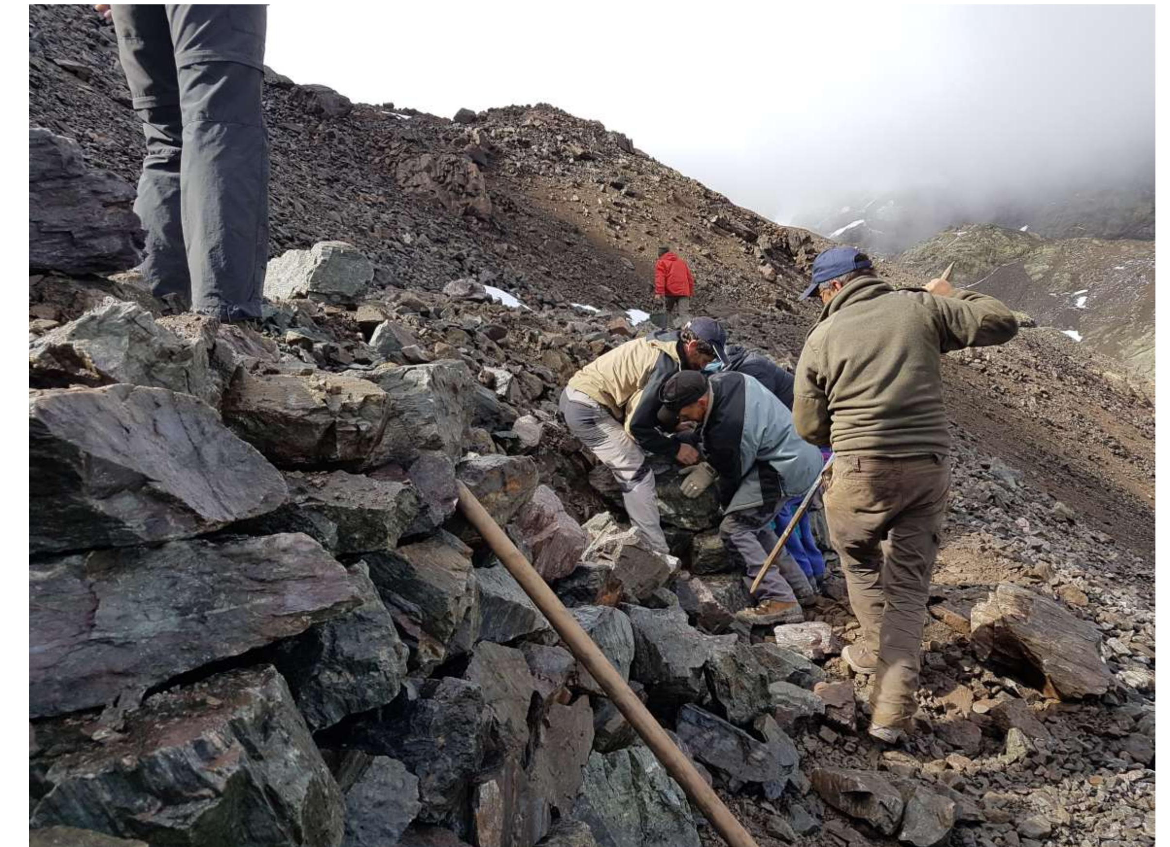
Mur de blocs en cours de montage le long du boyau, afin de maintenir une charge égale de part et d'autre de la voûte.