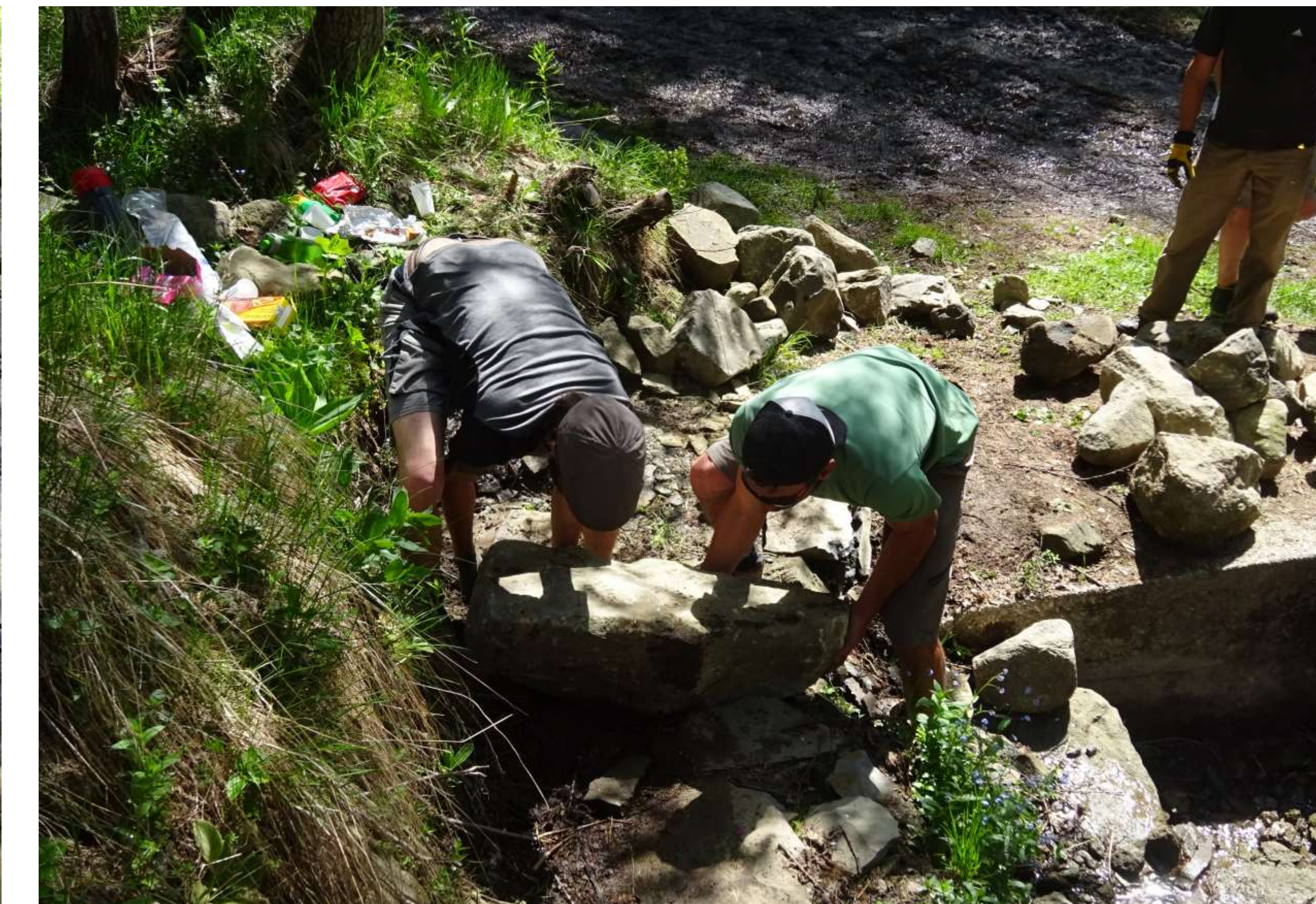
Collecte et sélection de blocs pour la reconstruction.