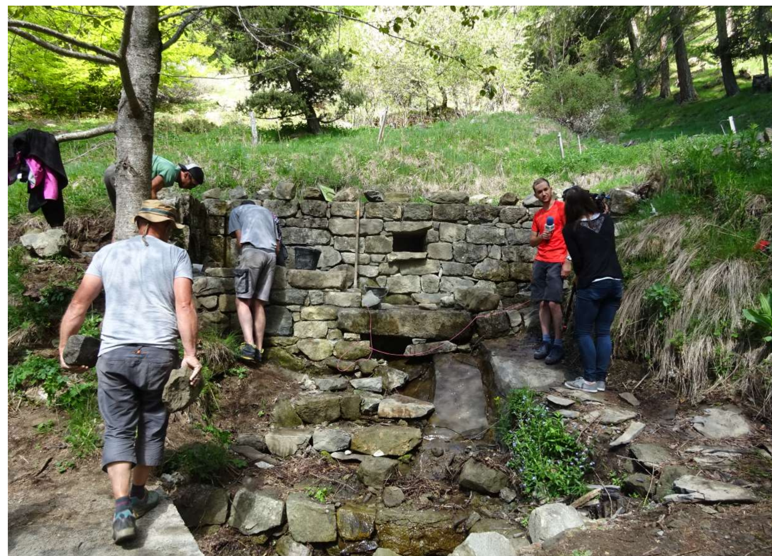
Reconstruction des ébauches du mur Est de la martelière des Oures. Objectif : donner à voir le volume du bassin.