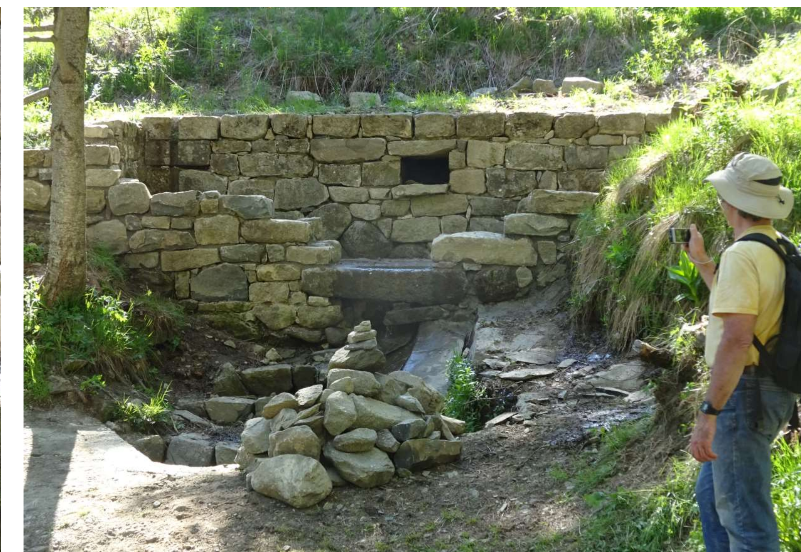
Vue d'ensemble en fin de journée. Chantier à poursuivre en 2018.