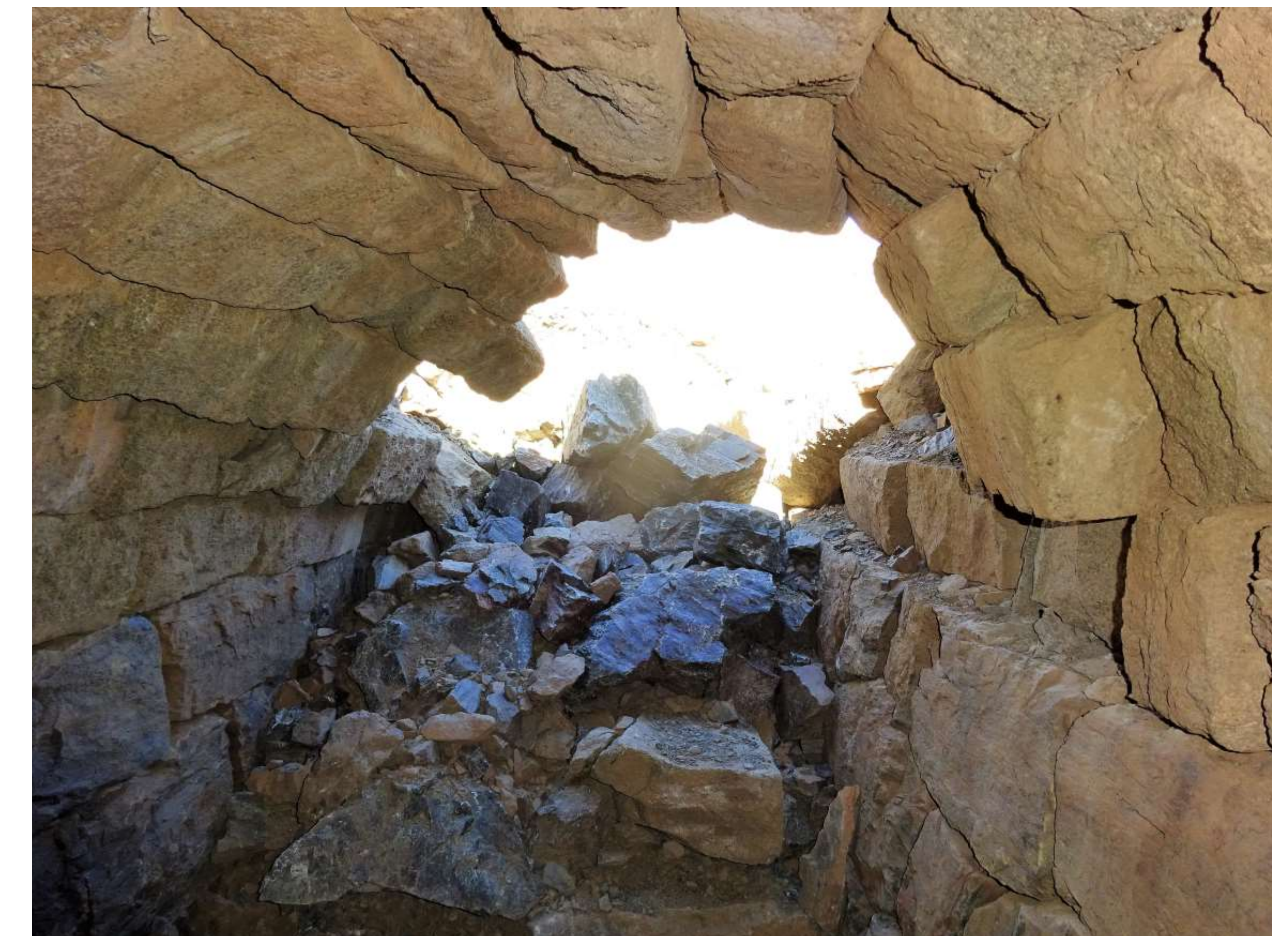
La voûte encore en place a été déformée par l'impact.