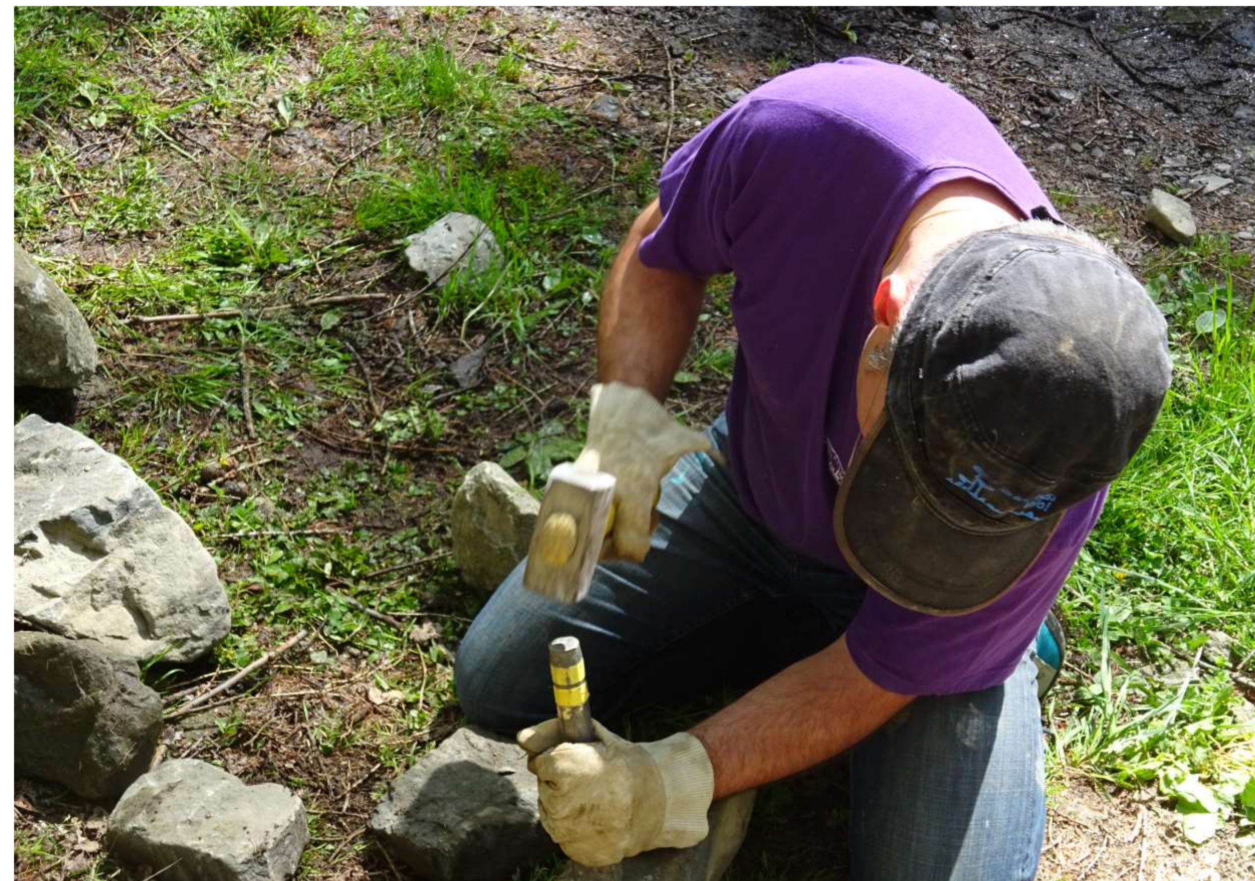
Préparation de blocs pour la reconstruction.