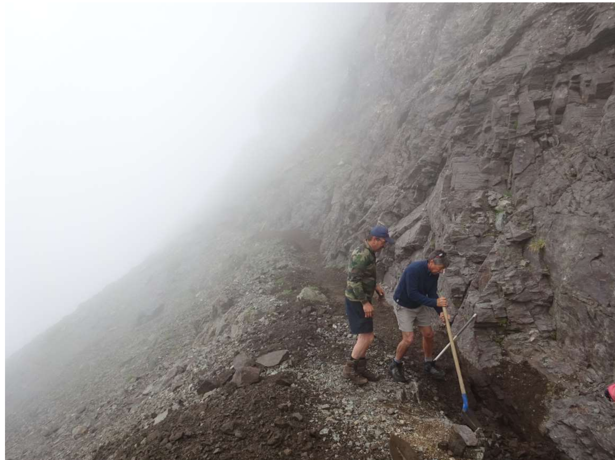
Amélioration de la banquette permettant d'accéder au tunnel, dans le vallon de Malcros.