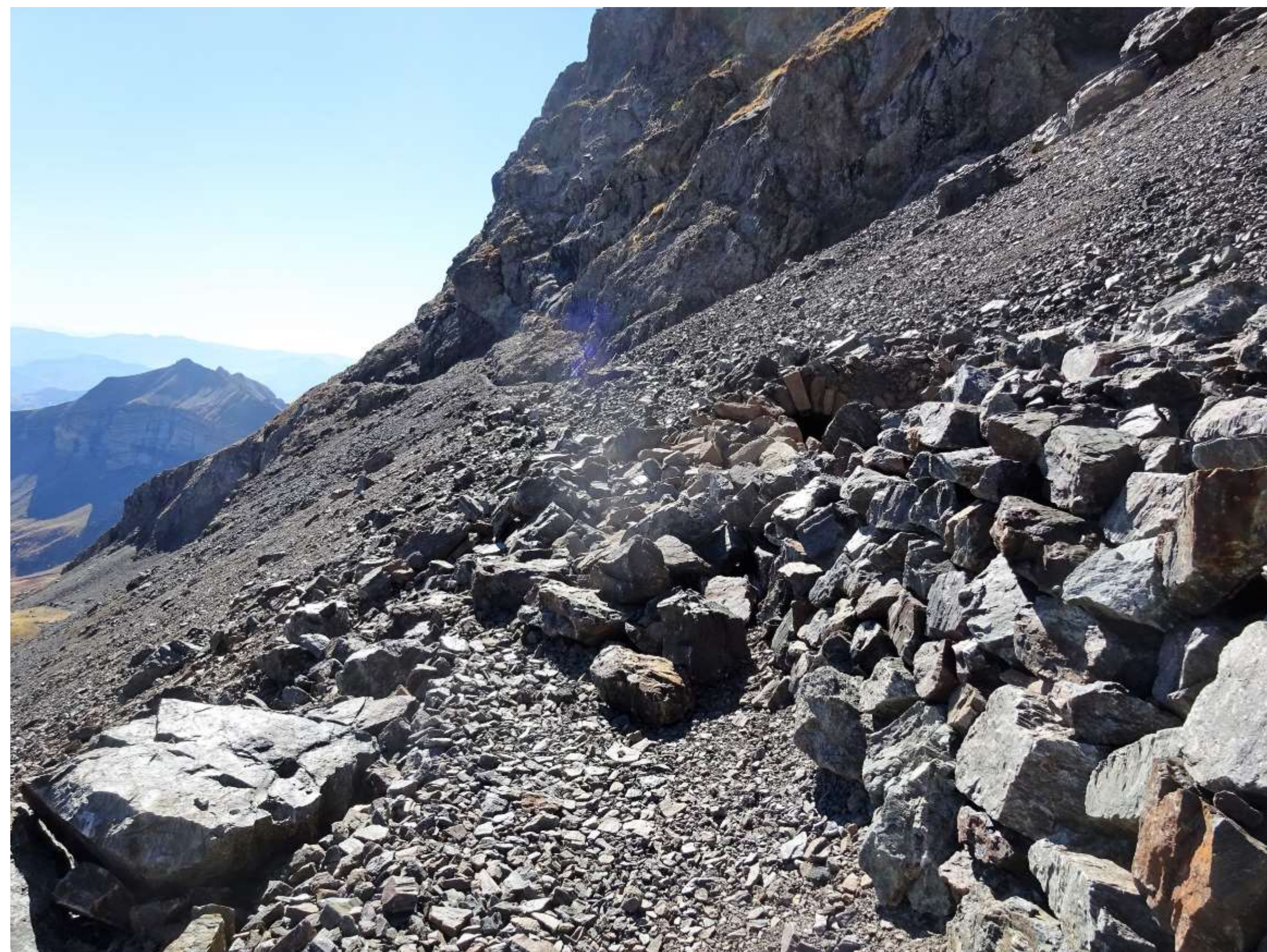
Éboulement majeur entre le 23 et le 28 juillet. Des blocs de plusieurs tonnes se détachent de la falaise sommitale.