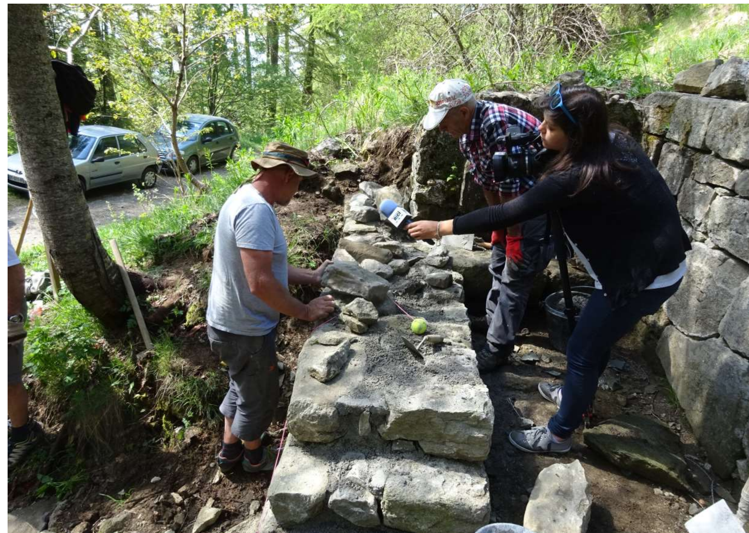
Vue de l'ébauche gauche permettant d'en apprécier l'épaisseur.