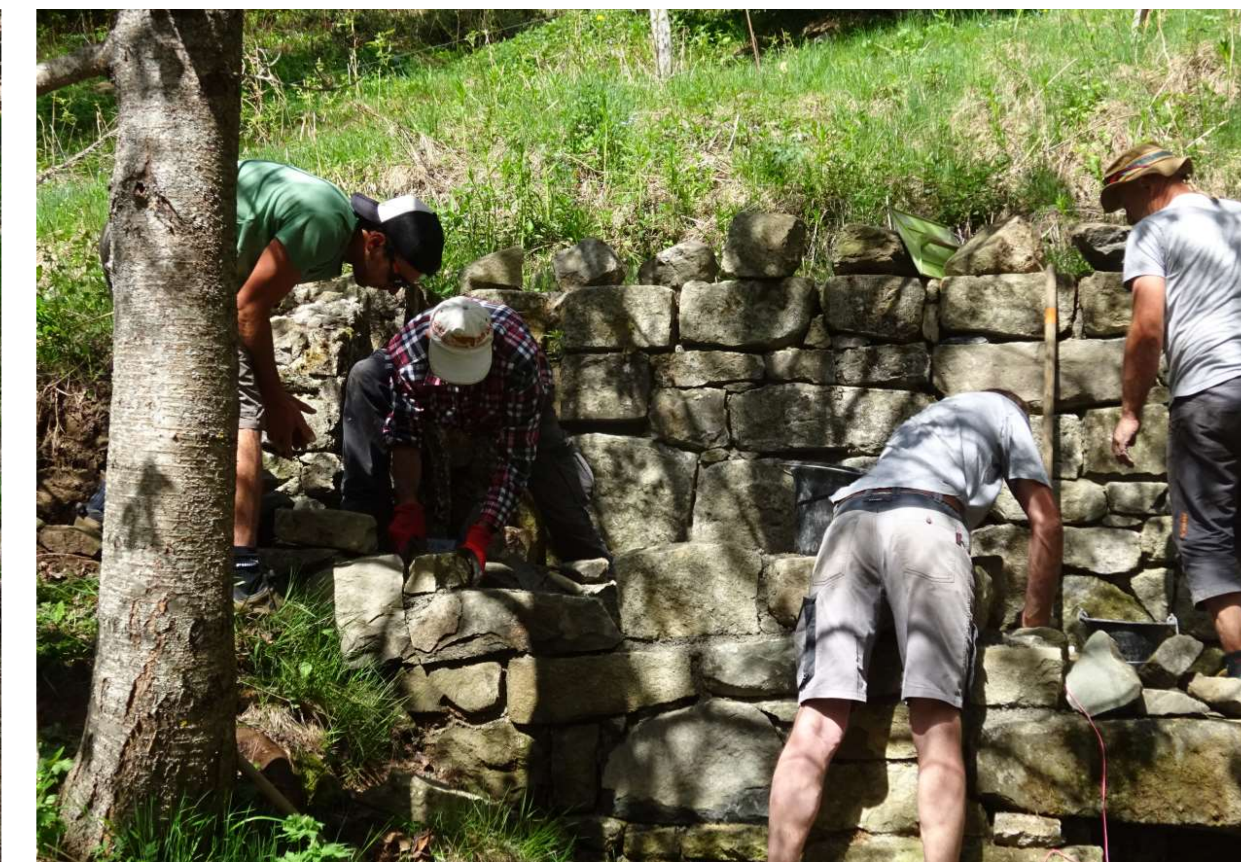
Élévation de l'ébauche gauche selon appareillage du mur Ouest visible en fond sur la photo.