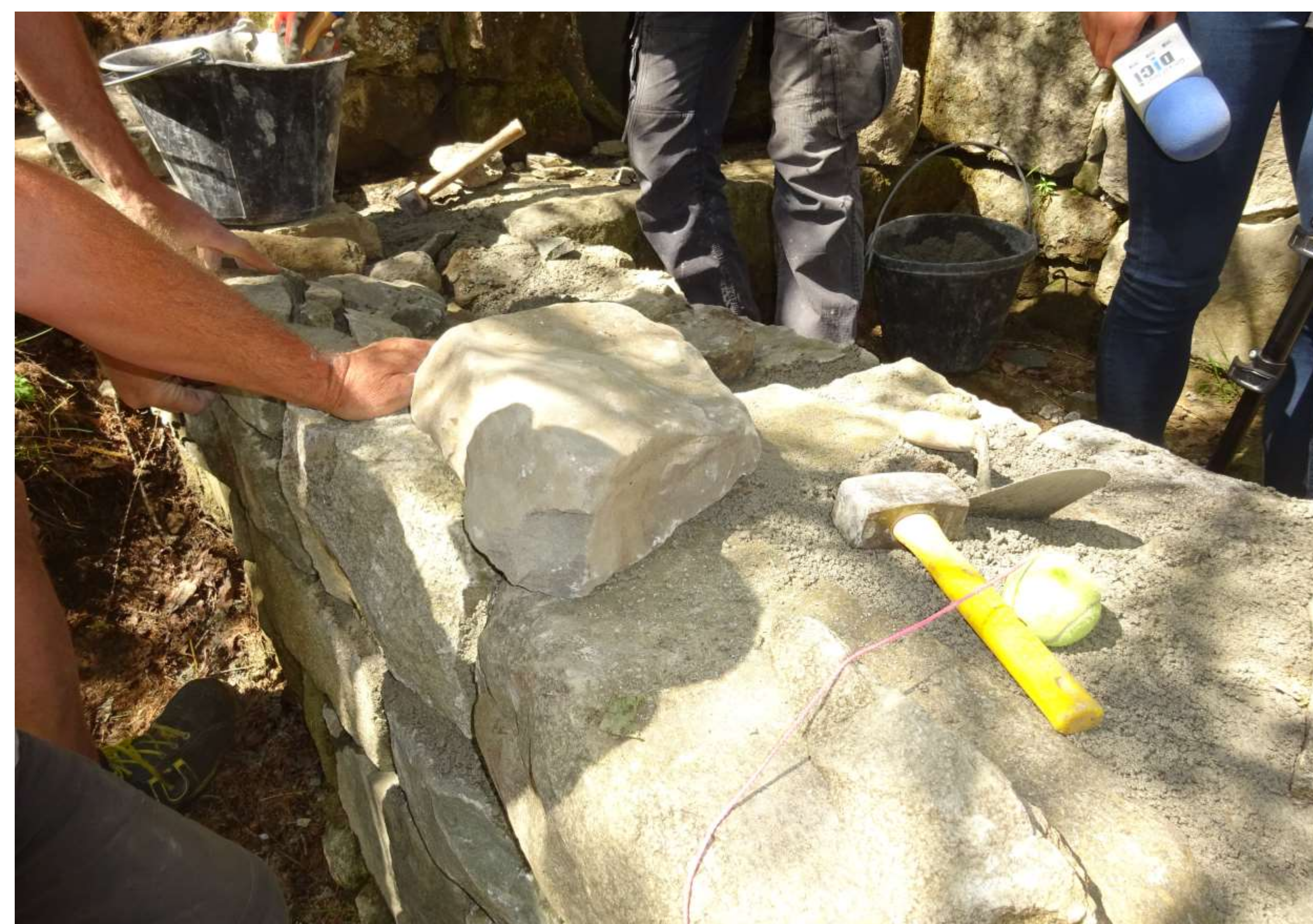
Ébauche en cours de remontage.