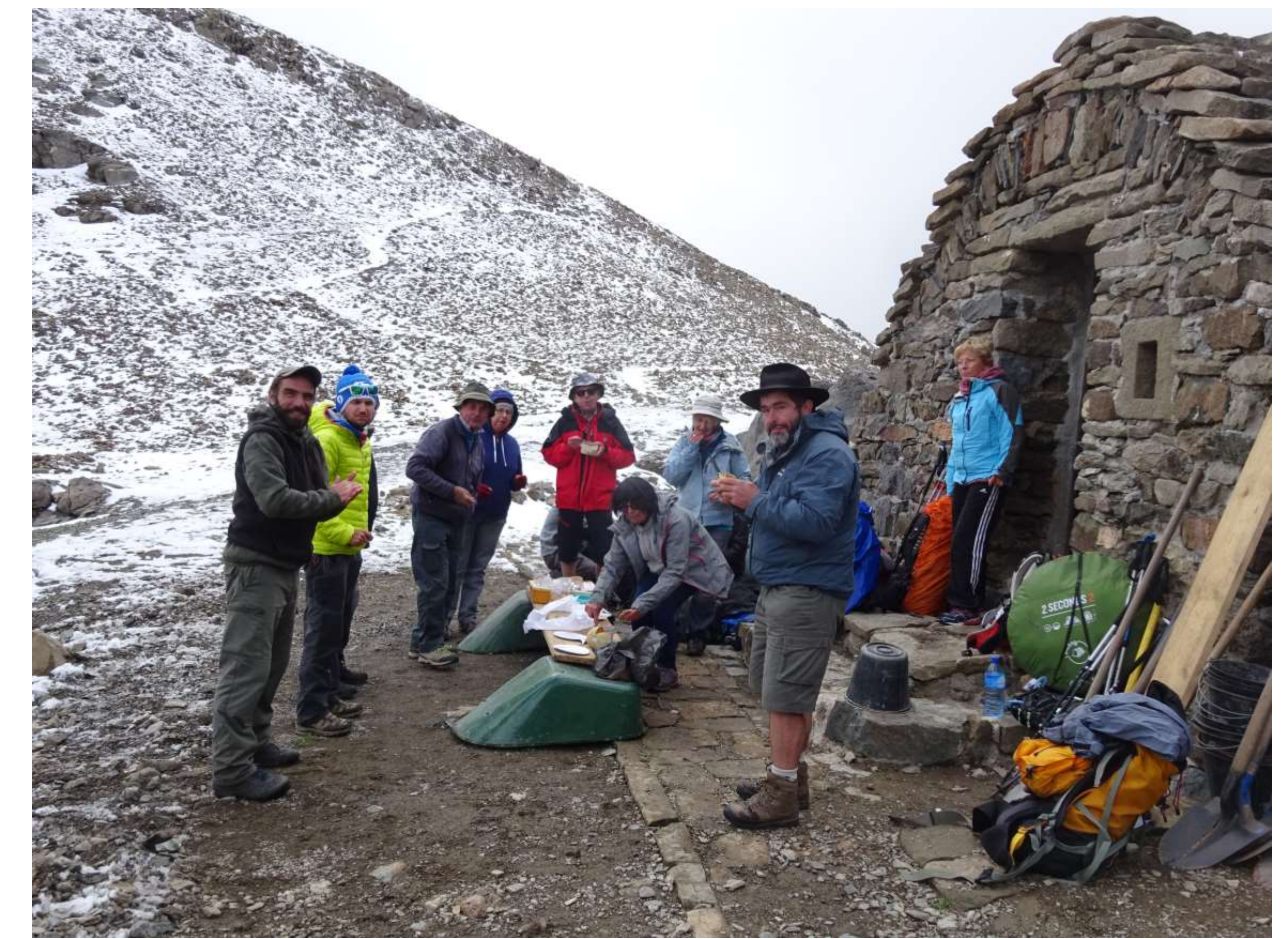
Certes, les conditions ne sont pas les meilleures, mais le chantier va s'organiser. D'autres compagnons vont monter.