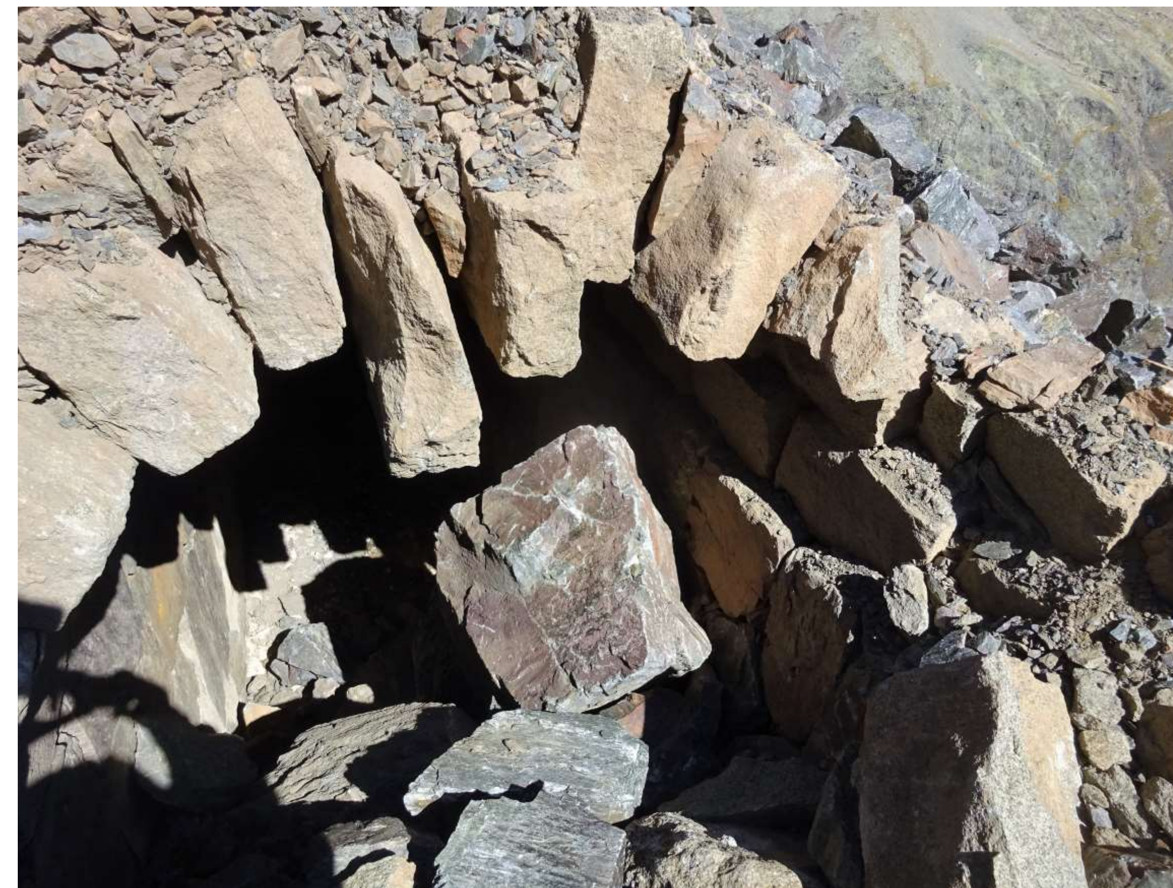
Le tunnel est littéralement pulvérisé sur plusieurs mètres en deux emplacements.