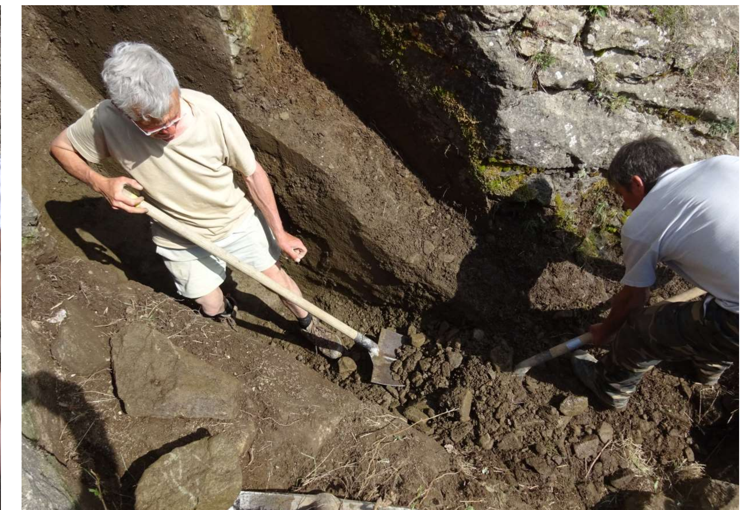
Déblaiement de la rigole « plongeante » en amont du tunnel du Sellaret.