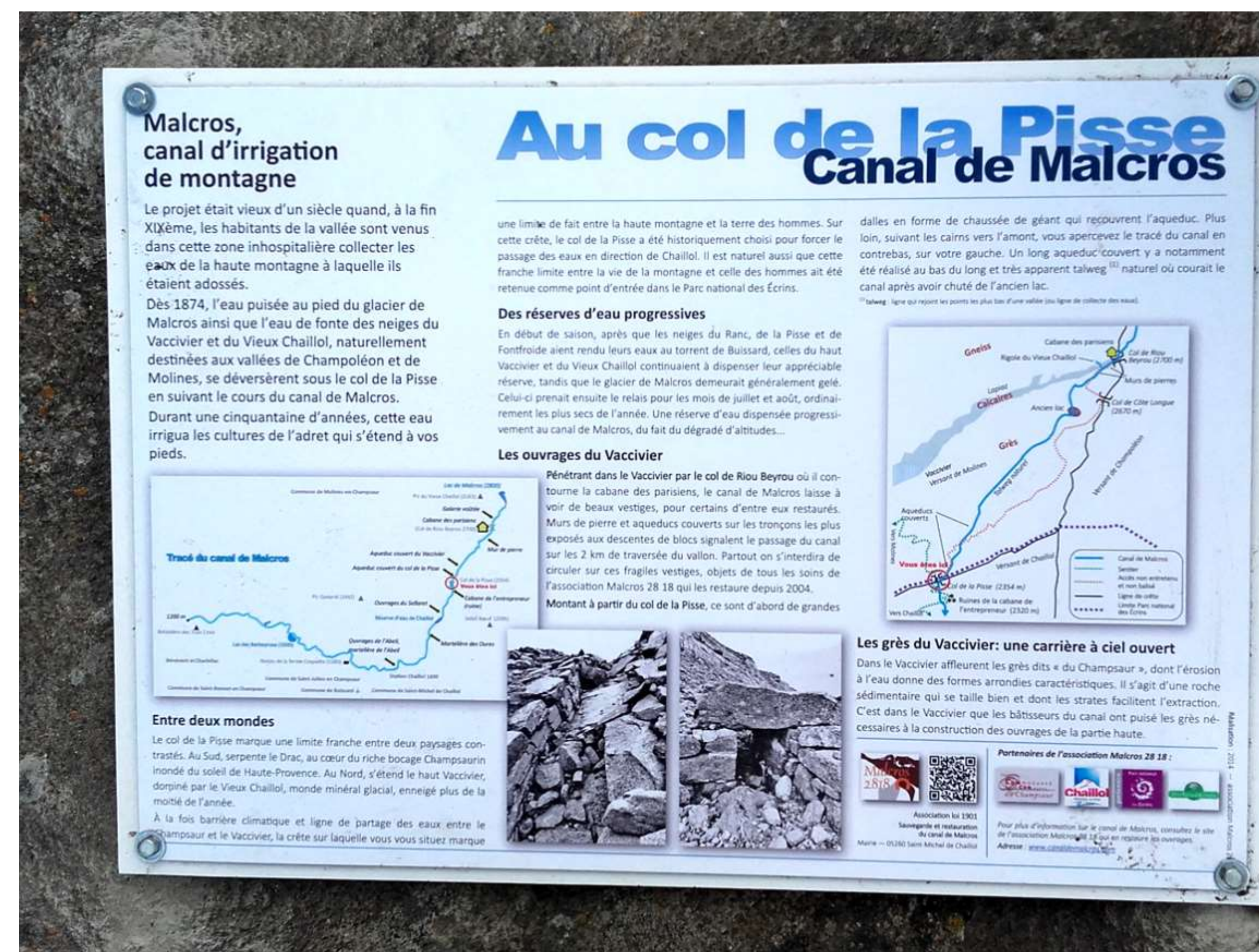
Pose d'un panneau explicatif au col de la Pisse (rocher au sol, en limite extérieure du Parc national).