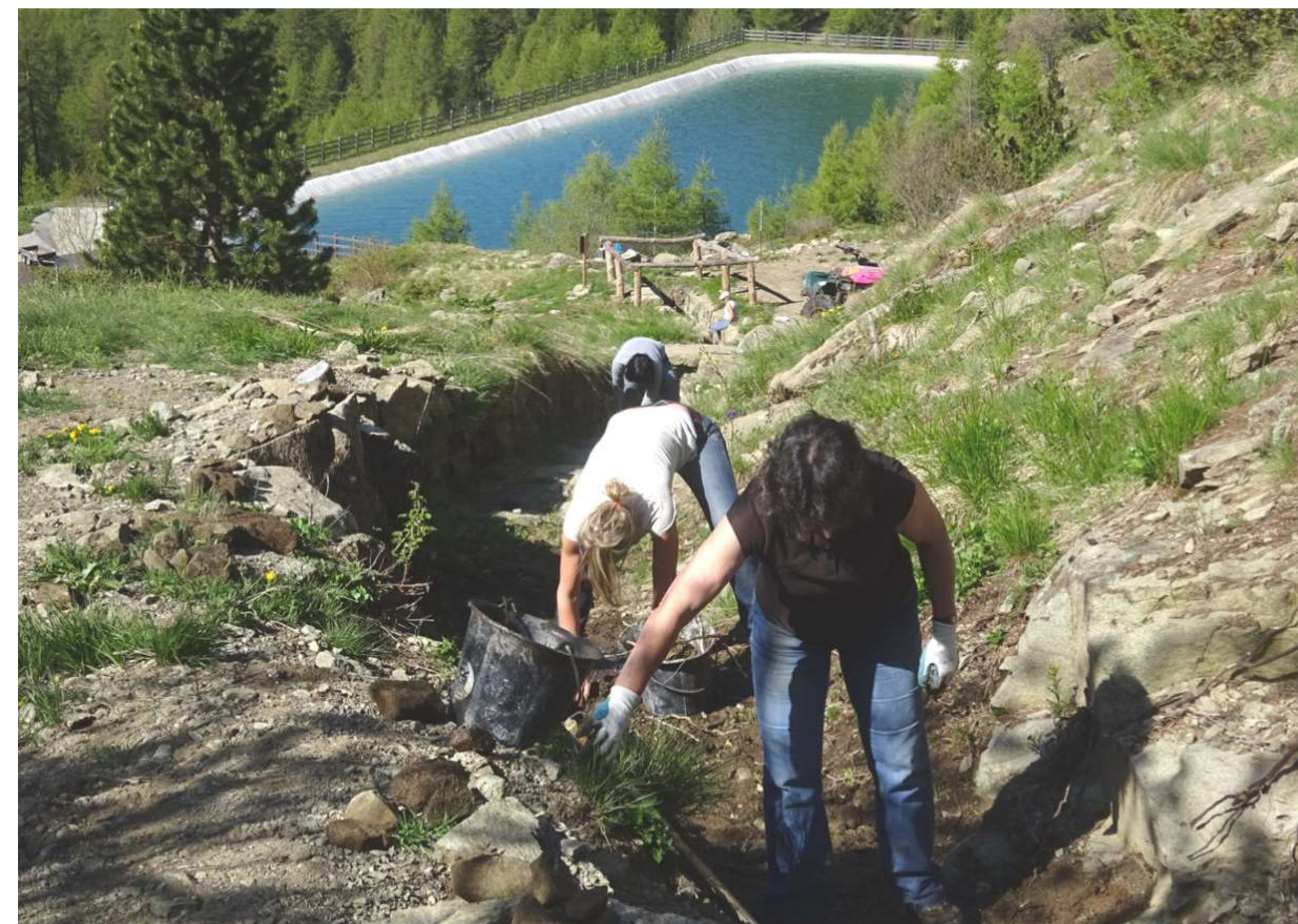
Entretien général du site du Sellaret : curage de la rigole principale.