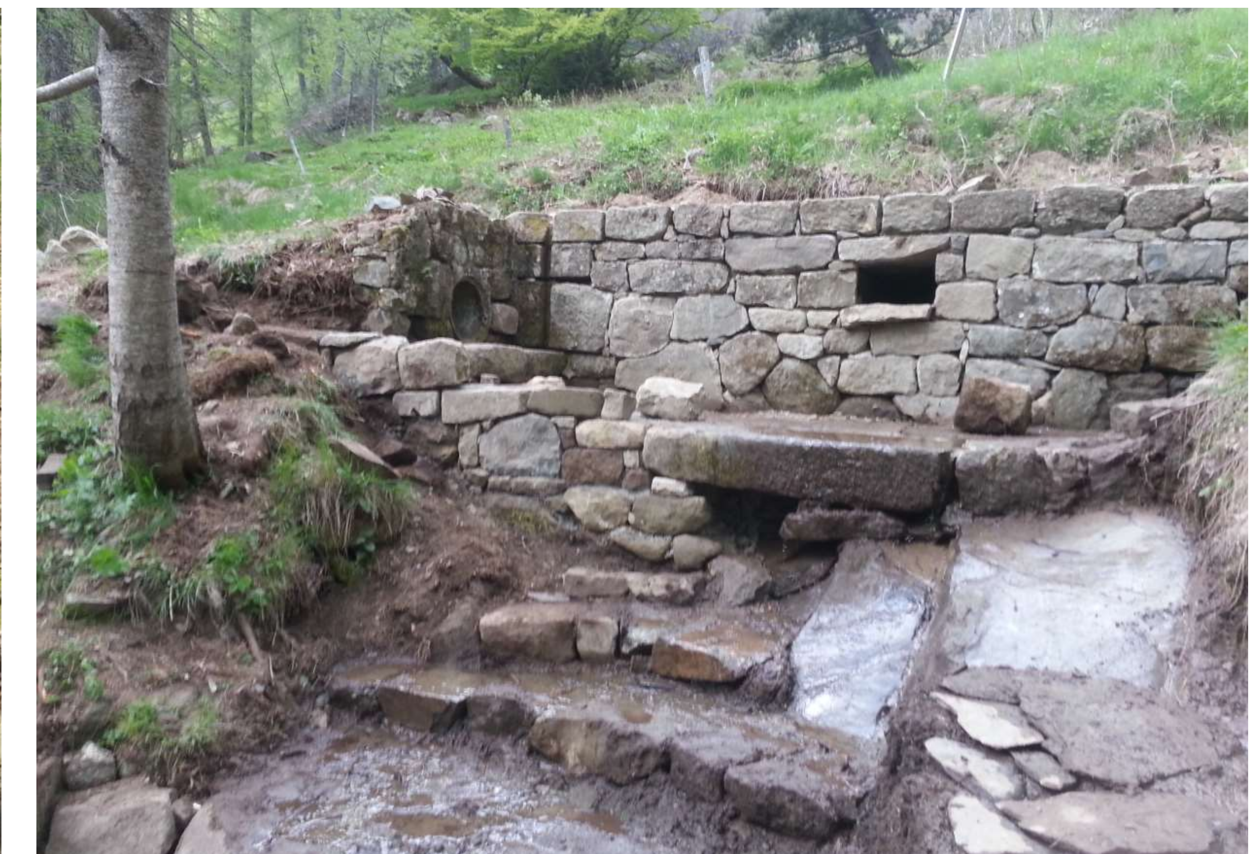
Martelière des Oures : amorces du mur Est, aménagement de l'exutoire et drainage de l'espace de circulation des visiteurs.