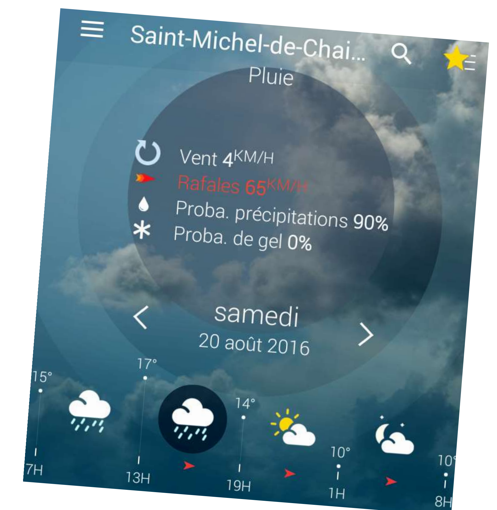
18 août 2016 : prévision pour le 20 août. La météo tiendra ses promesses... Chantier annulé.