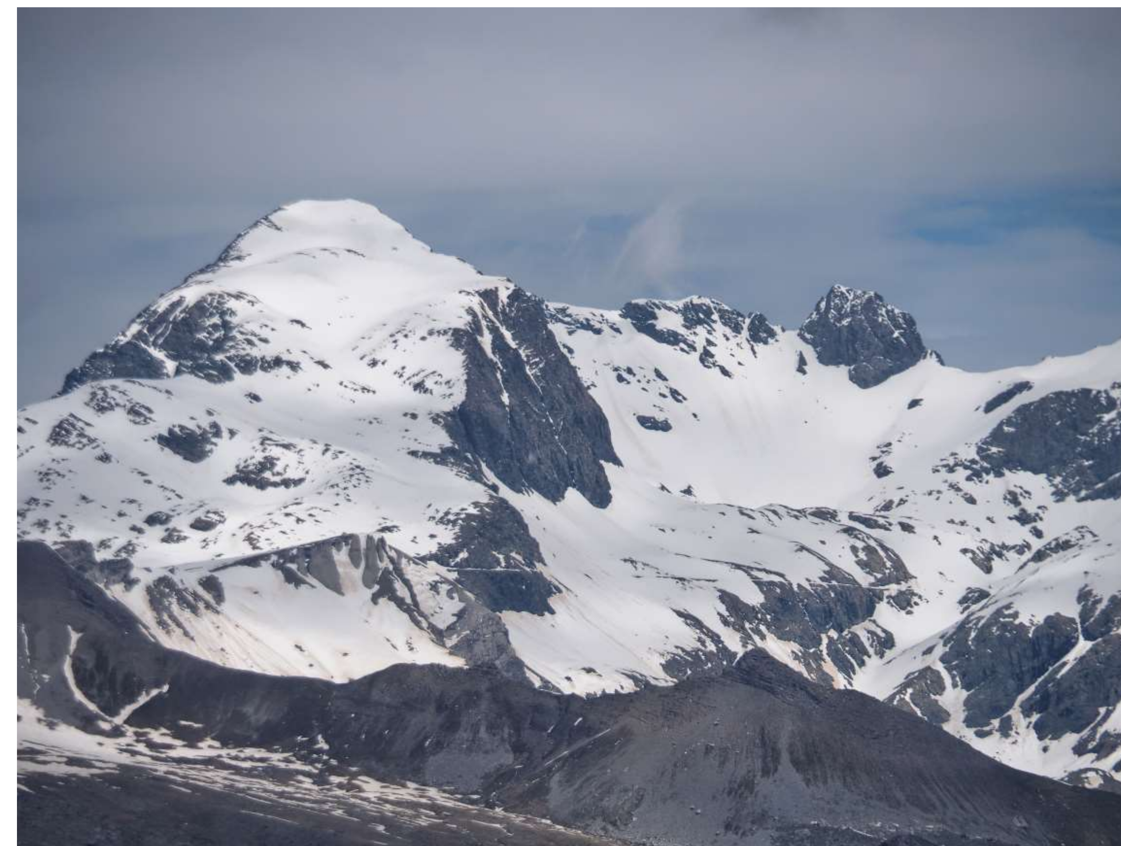
État de l'enneigement au 26 mai 2016 : normal pour la saison.