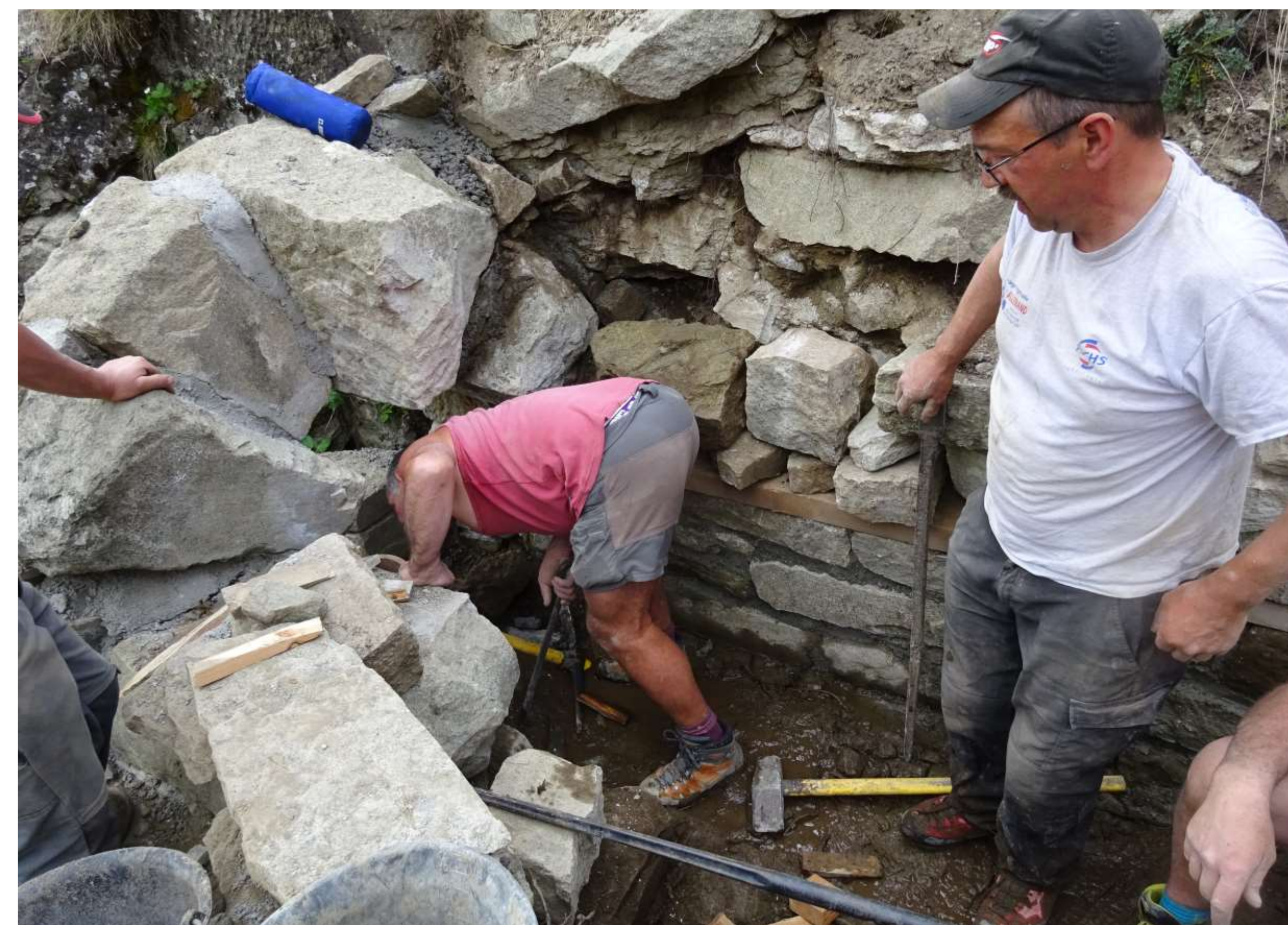
Reconstruction des assises de voûte du tunnel du Sellaret.