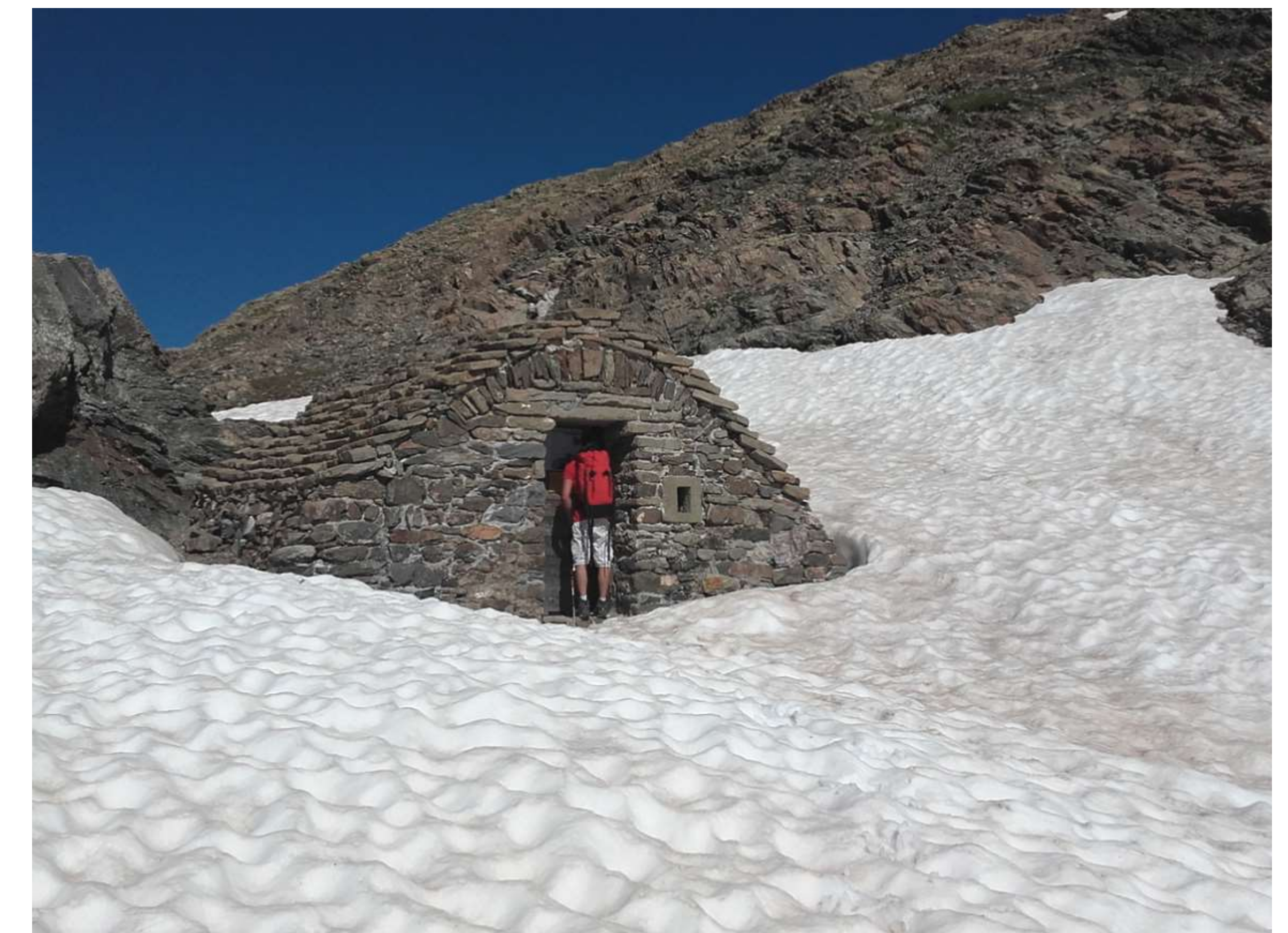
29 juin 2016 : neige encore abondante à 2700 m. Chantier reporté.