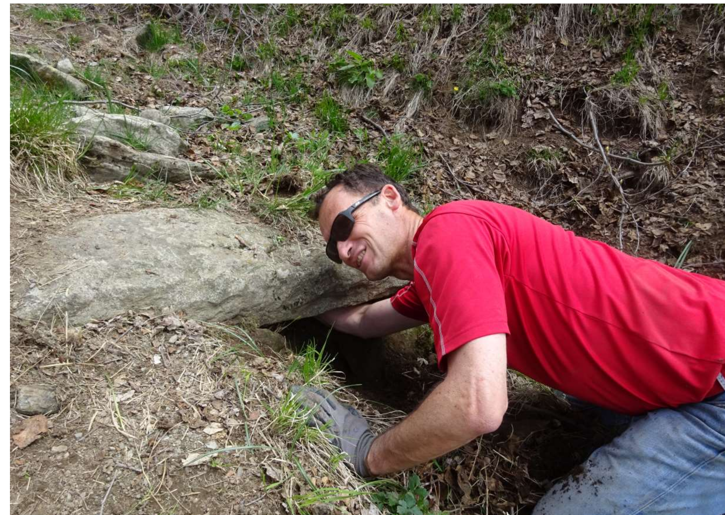
Premières investigations au point de bifurcation du canal vers les ouvrages du Sellaret.