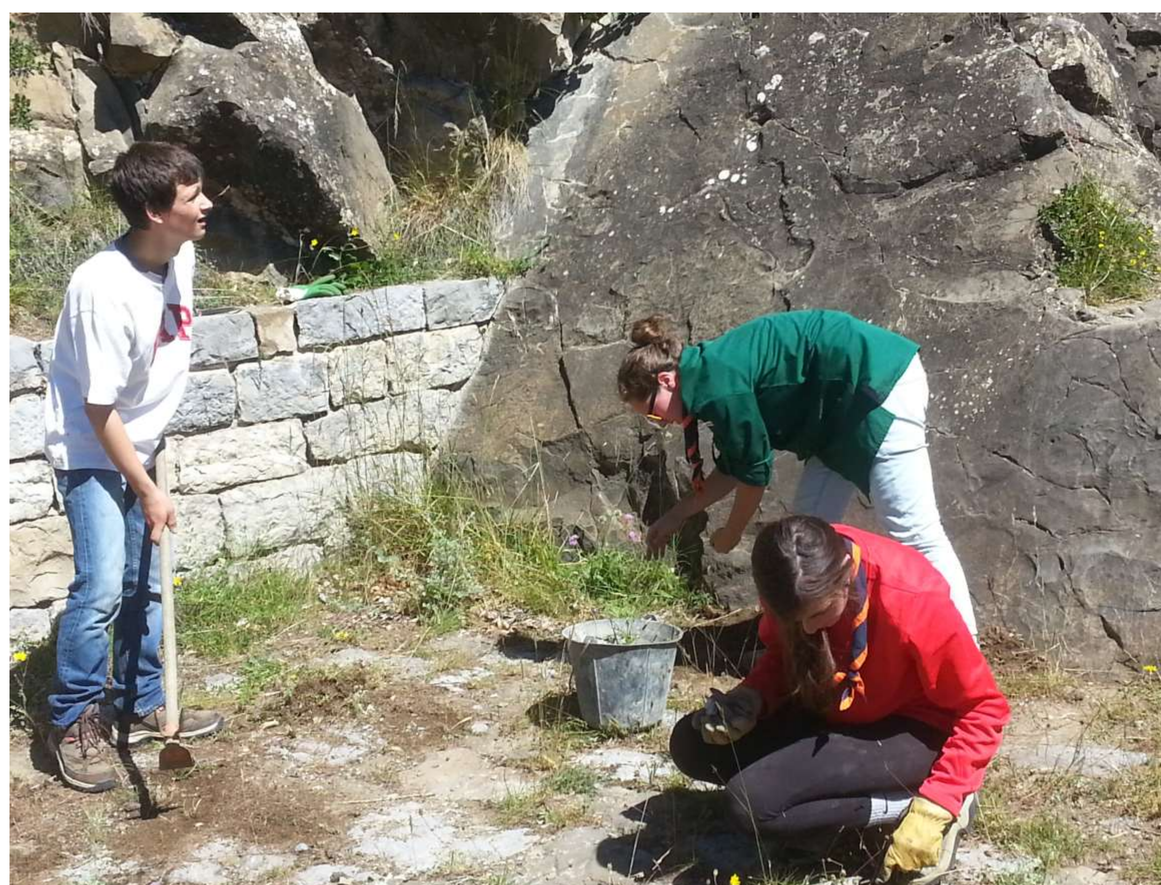
Élimination de reprises de végétation (martelière de l'Abeil).