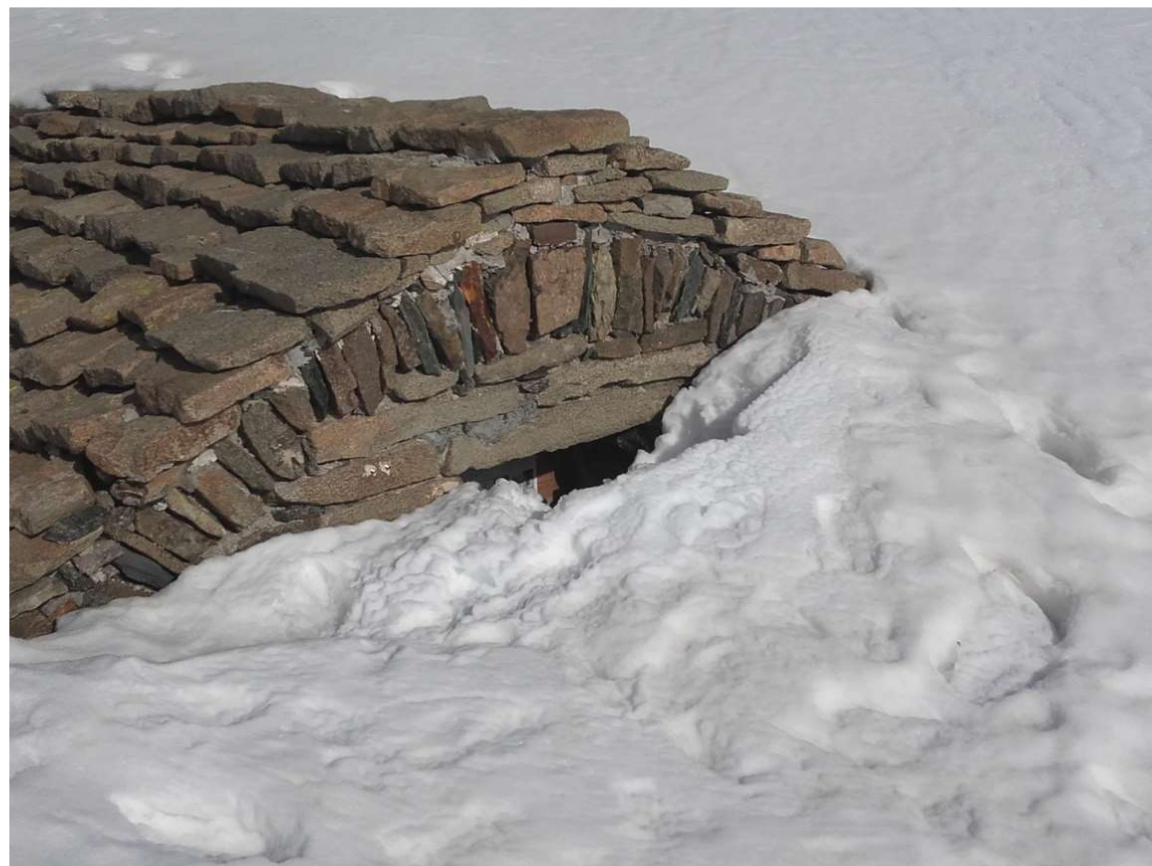
État de l'enneigement le 22 mai 2016 : normal pour la saison.