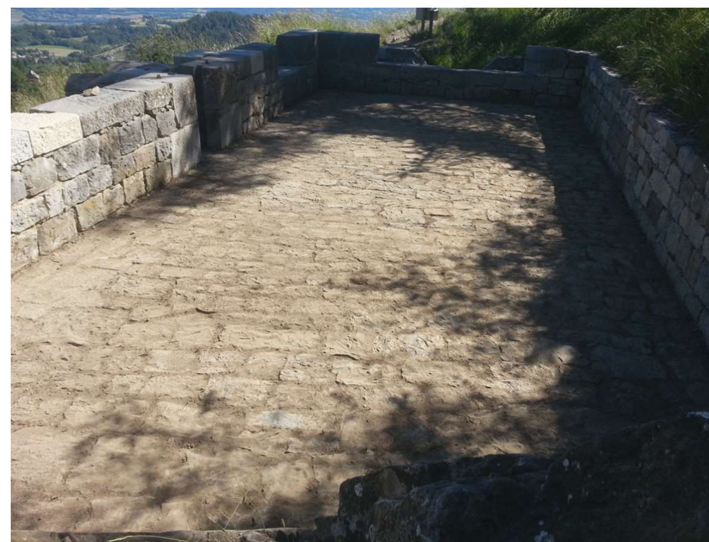
Martelière de l'Abeil après sa cure d'entretien.