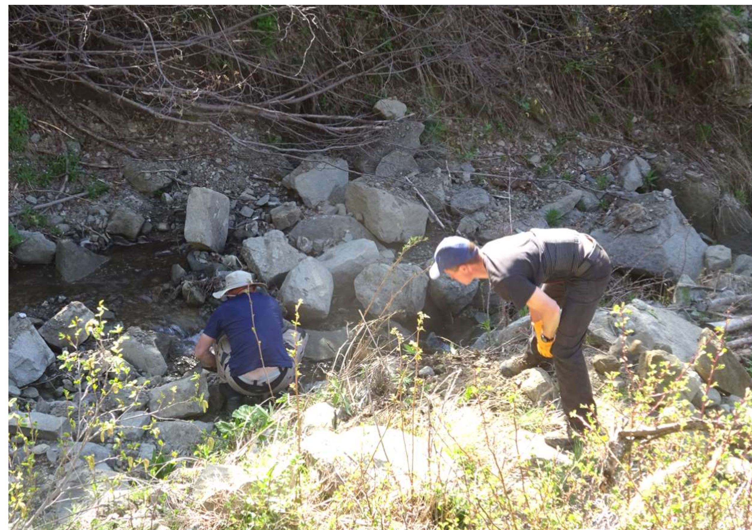
Renflouement de pierres de voûte du tunnel échouées dans le torrent, en contrebas des ouvrages du Sellaret.