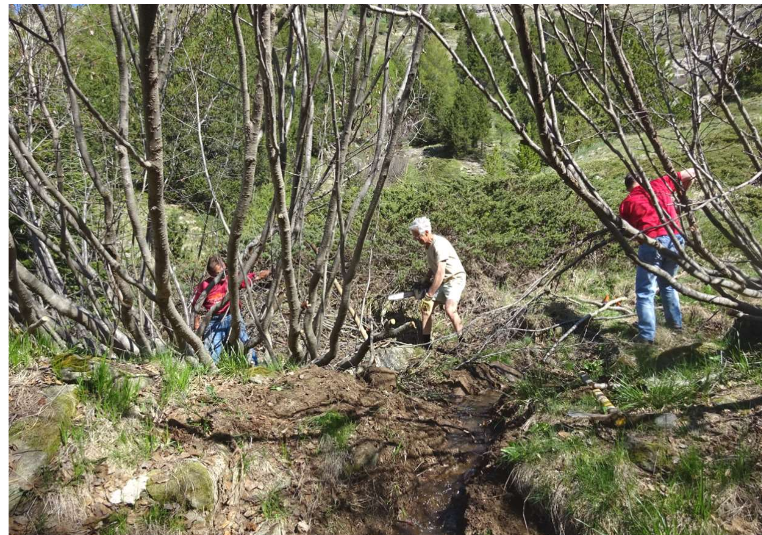
Dégagement du canal sur la croupe, en amont des ouvrages du Sellaret.