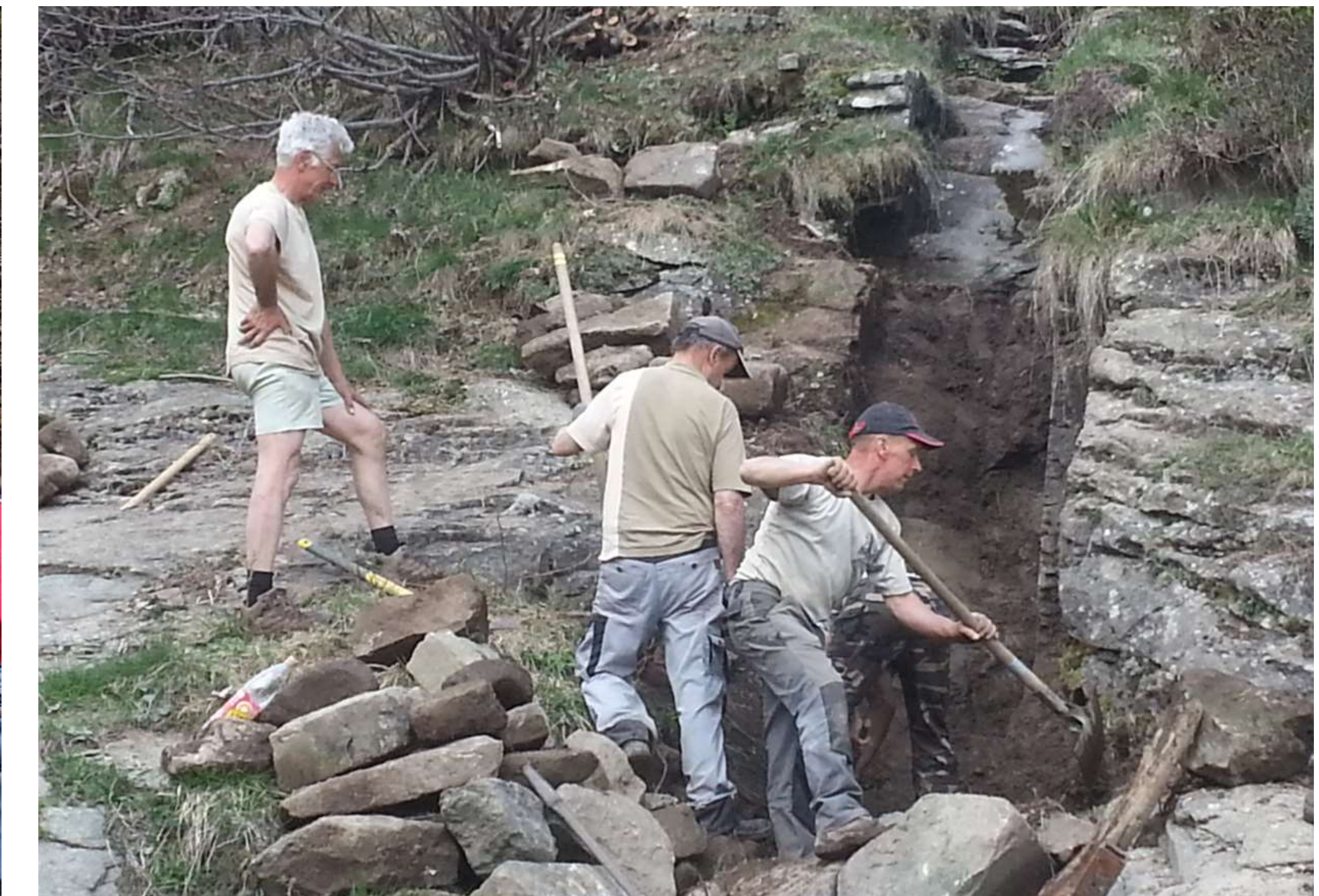
Au Sellaret, vue sur la rigole « plongeante » en cours de déblaiement.